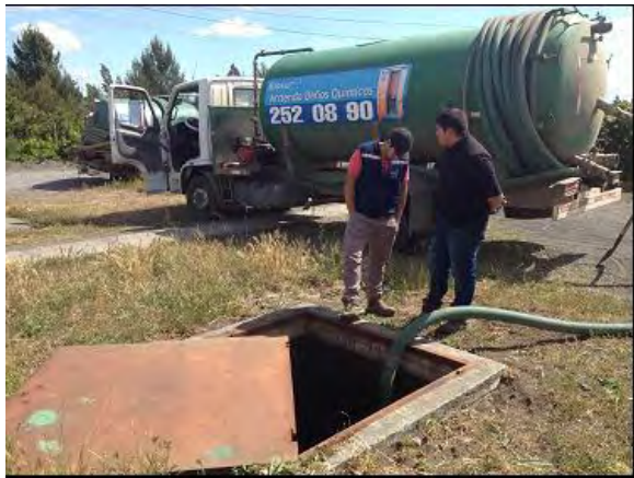
Imagen N°1: Limpieza de Fosas Sépticas.