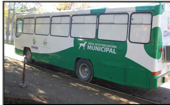
Imagen N°4: Clínica Veterinaria Móvil.