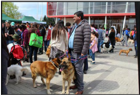
Imagen N°3 Feria de Adopción Tenencia Responsable de Mascotas, contempló un operativo de adopción canina y la vacunación de perros y gatos. (7/10/2017).