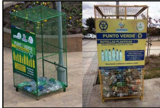
Imagen N°2: Puntos Verdes