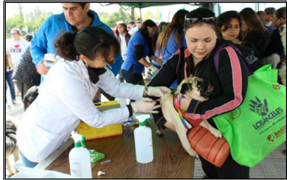
Imagen N°2: Feria de Adopción y Tenencia responsable de Mascotas (Contempló un operativo de adopción canina y la vacunación de perros y gatos)