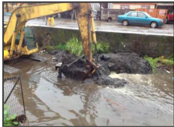
Imagen N°2: Limpieza de estero Quilque