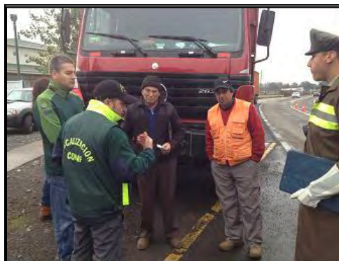
Imagen N°2: Mesa de Fiscalización del transporte de leña en la comuna (SII, CONAF, Municipalidad de Los Ángeles)