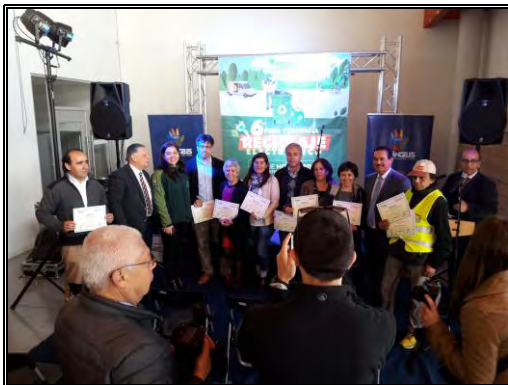
Imagen N°5: Reciclaje Electrónico (3 y 4 de Noviembre 2017)