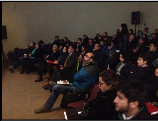
Imagen N°1: Seminario Ambiental, Ley Responsabilidad Extendida del productor