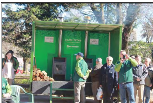
Imagen N°3: Carro demostrativo que es utilizado en cada época invernal para educar y promocionar el uso de leña seca.