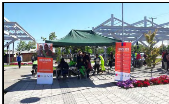
Imagen N°6: Operativo Plaza Feria (11/11/2017)