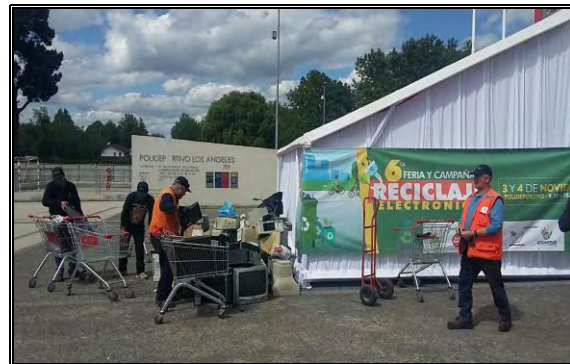
Imagen N°6: Reciclaje Electrónico