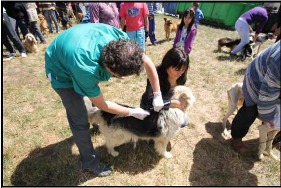
Imagen N°1: Operativo de vacunación y desparasitación (6 agosto, sector Villa San Luís)