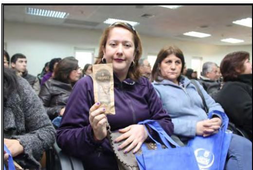
Imagen N°1: Entrega de Dispositivo economizador de leña, (se han entregado desde el año 2014 hasta el 2017).