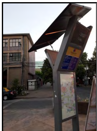
Imagen N°5: Reloj que entrega información.