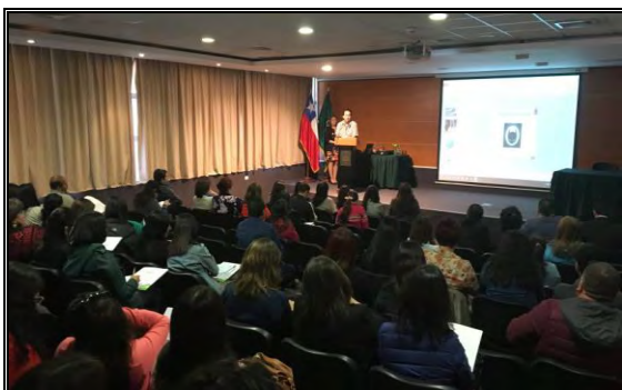
Imagen N°5: Primer Seminario de Zoonosis Organizado por la Dirección de Medio Ambiente (24/11/2017)