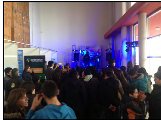
Imagen N°4: Reciclaje Electrónico 2016.